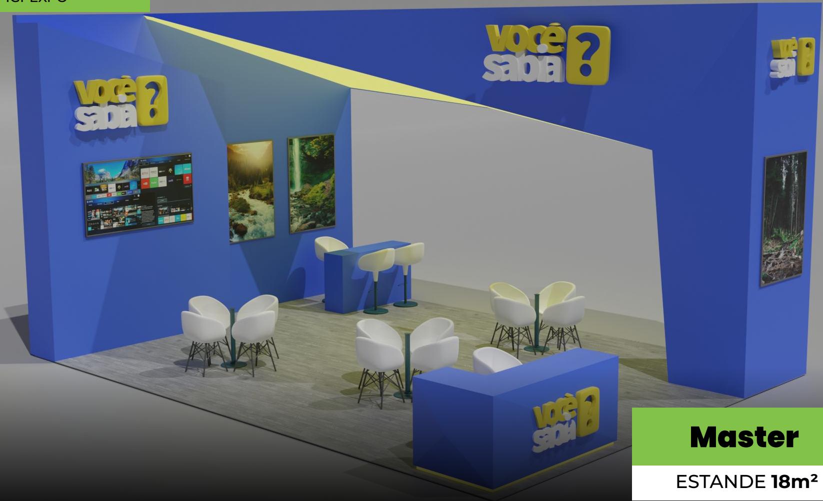
Master ESTANDE 18m 2