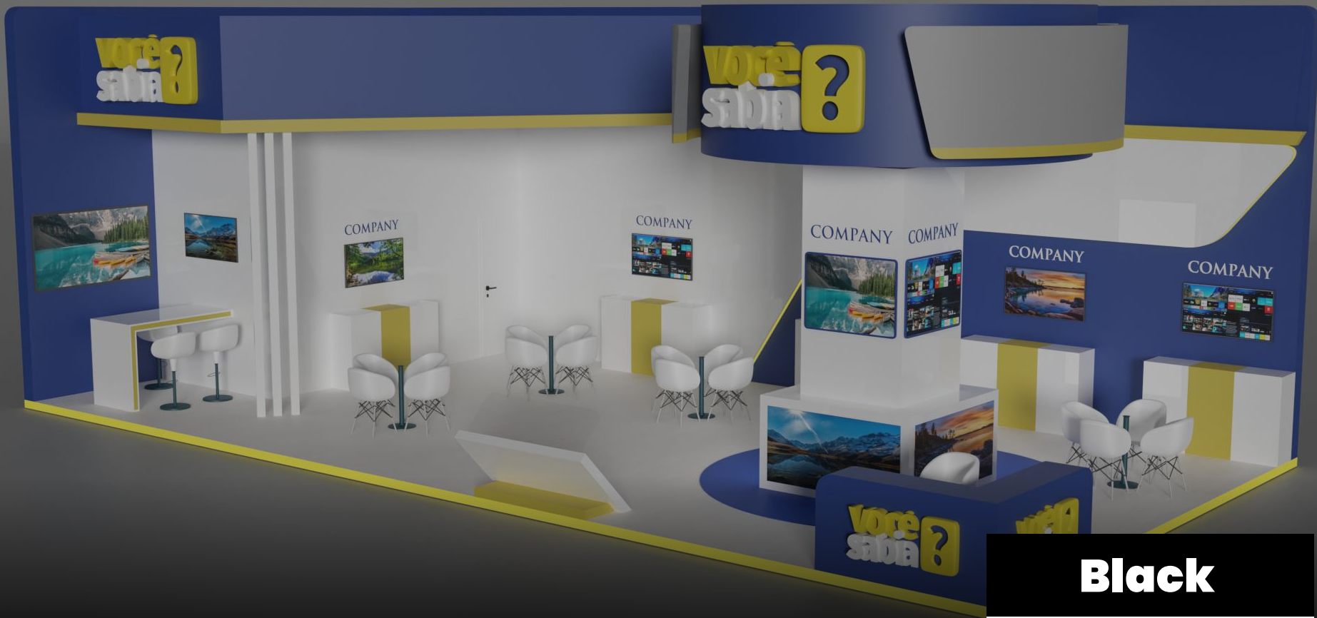
Black ESTANDE 36m 2